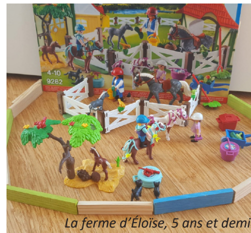
La ferme d'Éloïse, 5 ans et demi

Les rubriques à venir seront celles que vous déciderez.