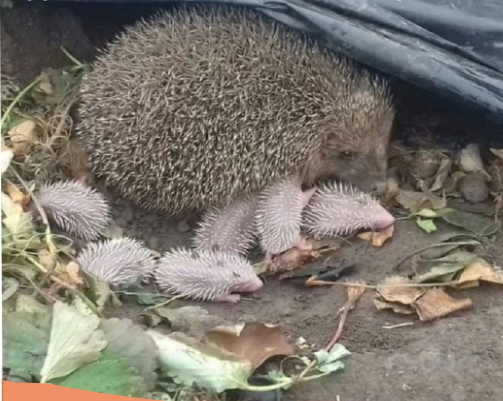
Photo prise dans le jardin d'un collègue d'une maman hérisson et ses petits appelés hérissonneaux ou choupissons.