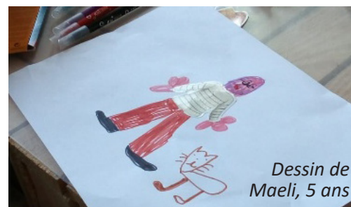
Dessin de Maeli, 5 ans

À bientôt de vous retrouver en mots, en images, en pensées.