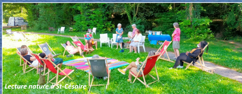
Lecture nature à St-Césaire