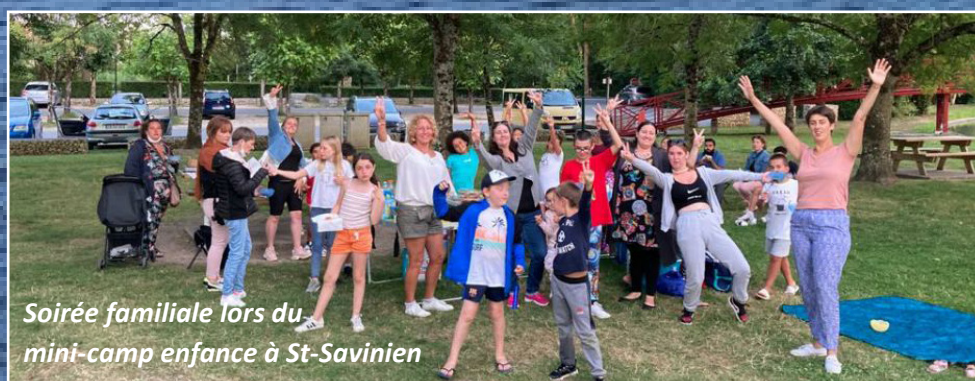
Soirée familiale lors du mini-camp enfance à St-Savinien