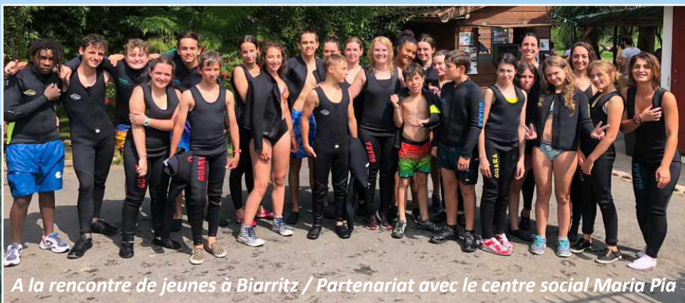
A la rencontre de jeunes à Biarritz / Partenariat avec le centre social Maria Pia