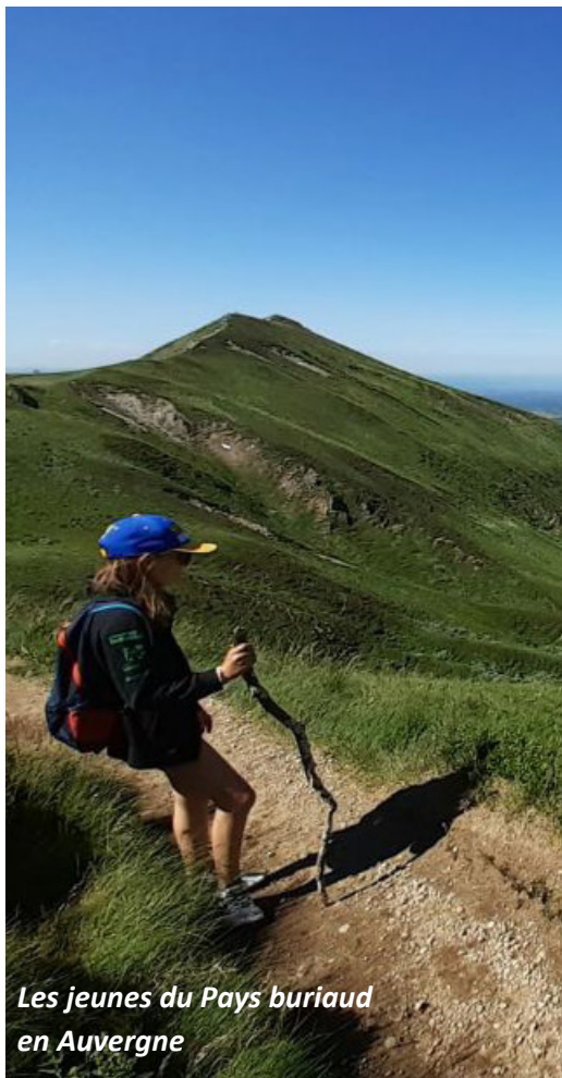
Les jeunes du Pays buriaud en Auvergne

C'est la rentrée ! Plaisir de nous retrouver, de reprendre les actions et projets : l'accompagnement à la scolarité, le Lieu Accueil Enfant-Parents, les groupes de parole, les animations pieds d'immeubles, les projets jeunesse, etc. Cependant, nous sommes toujours dans un contexte sanitaire particulier avec ce nouvel élément restrictif : le passe sanitaire. Nous le savons, le sujet divise. Il y a ceux qui l'ont et l'utilisent et il y a les autres, ceux qui rayent activité après activité, resto, ciné, expos... Quand ils arrivent devant la porte de Belle Rive, ils posent la main sur la poignée et inmanquablement la question leur vient : ai-je le droit d'entrer ?