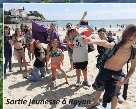
Sortie jeunesse à Royan

Hier, en fin de journée, des contes dans le jardin du Coran... quel moment doux et agréable dans un endroit si joli !